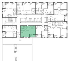
План 5 этажа