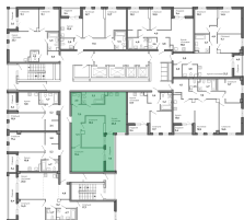
План 3 этажа