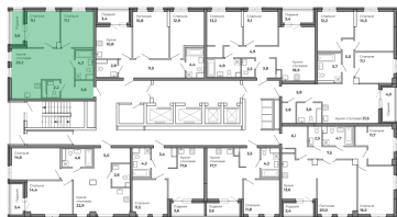
План 17 этажа